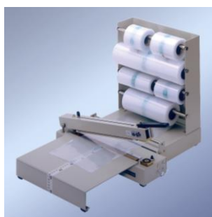
243 M 带膜卷架和工作台