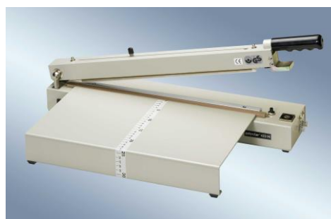
423 M 带工作台和切割器