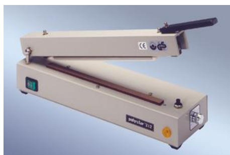
polystar® 242 不带切割器